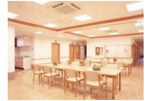
※食堂・機能訓練室

日中看護師常駐 認知症対応可能 夫婦用居室あり オゾン脱臭装置備付 協力医療機関あり